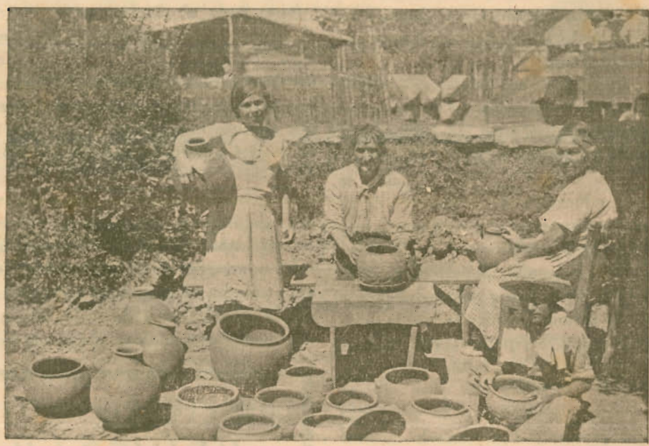
Escena de rincón de trabajo en Tejar (Cartago) en donde se elaboran las tradicionales tinajas y ollas que usa nuestro pueblo.